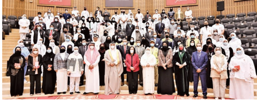
○ صورة جماعية للمكرمين بالسام.

السامي وإلى صاحب السمو الملكي ولي العهد رئيس مجلس الوزراء على توجيهاً سموه لكل الجهات المعنية بتسليم الوسام للعاملين في الصفوف الأمامية من الكوادر الصحية، وقوة دفاع البحرين، ووزارة الداخلية، وكل الجهات المساندة، معربين عن فخرهم واعتزازهم بأن يكونوا ضمن فريق البحرين، لافتين إلى أن هذا الوسام يعد دافعاً لبذل المزيد في خدمة مملكة البحرين ودعم تقدمها وإزدهارها.