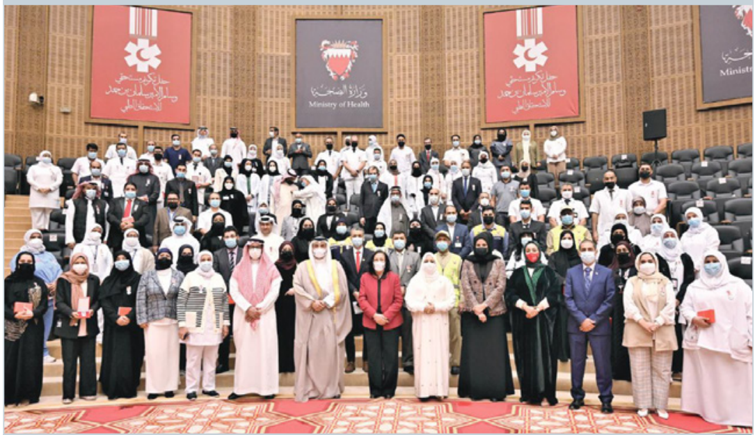
أبطال وزارة الصحة يتسلمون وسام الأمير سلمان للاستحقاق الطبي.