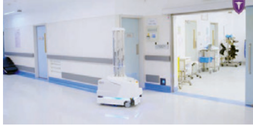
○ الروبوت الذكي يقوم بهام التعقيم.

بتقديم أفضل الخدمات الصحية في ظل وجود بيئة آمنة خالية من العدوى للمرضى والزوار والعاملين فيه، حيث تعمل أولوياته على ضمان سلامة الجميع داخل مرافقه، كما يولي اهتماماً كبيراً ومستمرًا باستقطاب أحدث التقنيات التكنولوجية التي تقيد في تطوير منظومته الصحية، والارتقاء بالمعايير العالمية لصحة المرضى.